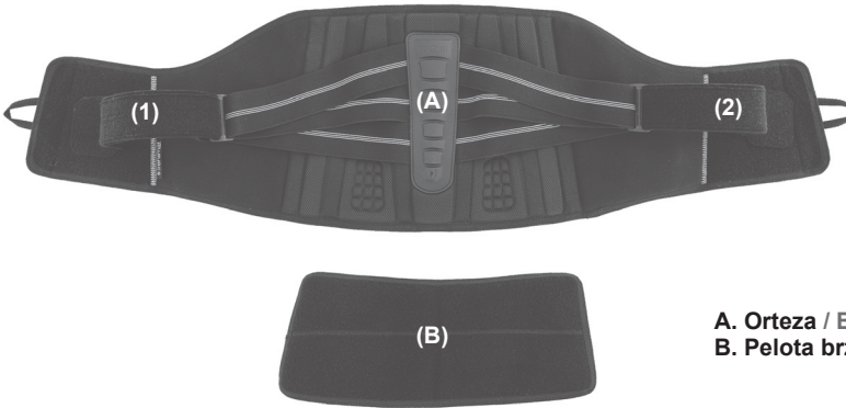
A. Orteza / Brace B. Pelota brzuszna / Abdominal pad