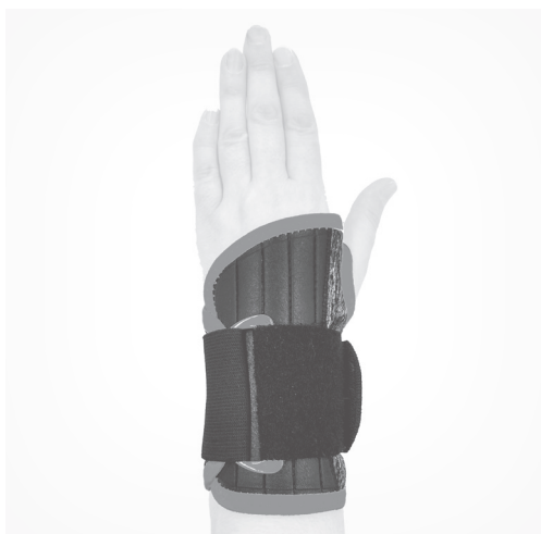
4. PL: Gotowy wyrób. EN: Product is ready to use.